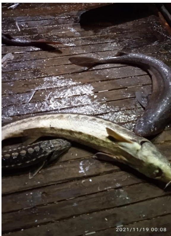
Рисунок 3 - Прилов осетра русского и акулы-катран при траловом промысле хамсы в Черном море (район банки Мария-Магдалина – Анапа)

Таким образом, полученные новые данные позволяют рассчитать среднюю массу осетра русского для северо-восточного района Черного моря (СВЧМ – вдоль побережья Краснодарского края), которая в настоящее время составляет 4,49 кг .