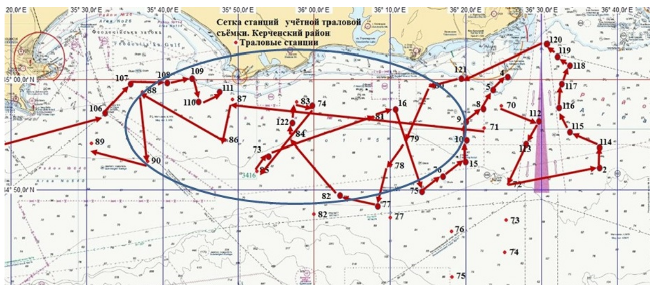
Рисунок 4 – Район поймок осетра русского в учетной траловой съемки по оценке запасов и эффективности размножения морских рыб в Чёрном море в 2022 г.

Все особи были пойманы в районе м. Опук – м. Киик-Атлама и Феодосийского залива (рисунок 4).