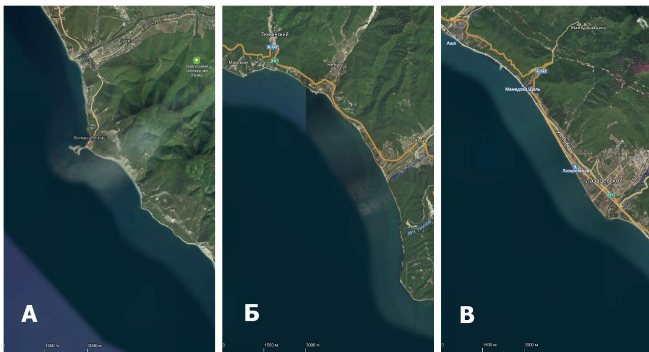
Рисунок 2 - Карты мест постановки сетей: район Большой Утриш (А), район п. Агой (Б), район п. Лазаревское (В)

В 2017 г. исследования проводили возле г. Анапа (Большой Утриш, п. Сукко), г. Туапсе (п. Агой) и п. Лазаревское до Зубовой Щели с 22 сентября по 5 октября (рисунок 2). Общая продолжительность работ - 15 суток.